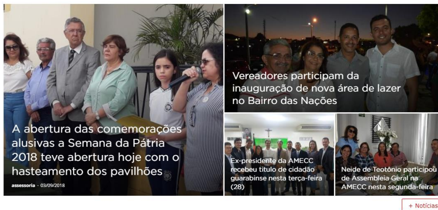
Figura 4 - Módulo de notícias mais recentes

O módulo de notícias é onde ficam disponibilizadas as notícias mais recentes postadas no site. As notícias postadas se referem a atos da gestão do ente ou divulgação de prestação de algum serviço.