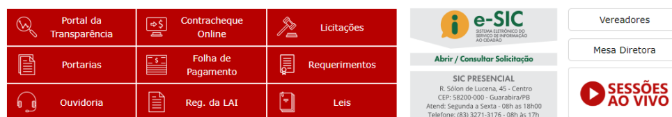
Figura 5 - Acesso rápido